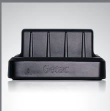
Station d'accueil pour bureau