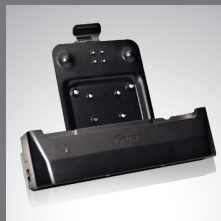
Station d'accueil pour véhicule