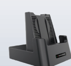
94A150095 Station d'accueil à emplacement unique